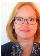
De Stéphanie Allemand

Mercredi 7 janvier 2015, 6h55. Les yeux rivés sur ma tartine, j'écoute la radio généraliste préférée des Français – une longue tradition familiale (!) – et sa chronique d'un humoriste. Au moins, on peut dire qu'il sait capter l'attention : « Chers auditeurs, je suis désolé, mais je ne vous souhaite pas une bonne année. » La journée commence bien. « Parce que je n'y crois pas, à cette formule. Il y a quelque chose qui cloche dans « Bonne année », qui sonne toujours un peu faux. Dans une année, il y a des joies, il y a des peines, il y a des barbecues sympas au début de l'été mais il y a aussi des dîners ratés. Il y a Grand-Mère qui a fini ton écharpe puis il y a "Tu devrais te dépêcher d'aller la voir". C'est ça une année, c'est ça la vie, non ? J'ai l'impression que c'est ça. Alors non, chers auditeurs, je ne vous souhaite pas une bonne année, je vous souhaite une année, je vous souhaite d'aller au bout, ce n'est déjà pas si mal... »