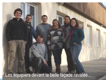
Les équipiers devant la belle façade ravalée...