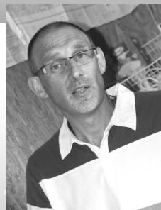
de Pascal Wicker

Une offre que nous pourrions intituler tout simplement i-Noël ! Le tout en un comprenant i-prière, i-Bible, i-église, i-famille, i-amour... I-réel ? Non, i-médiate en plus. Aucun délai d'attente pour une mise en